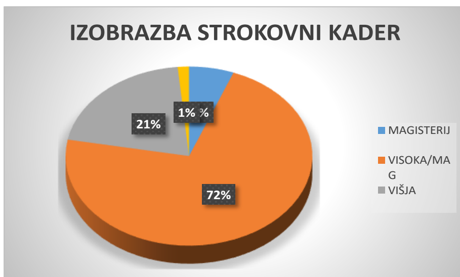
Graf, št. 2: Izobrazbena struktura pedagoškega kadra.